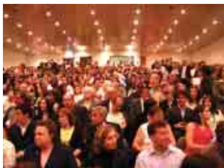
Aspecto geral da assistência

especial aos recém Licenciados e suas famílias. As festividades terminaram com a actuação da Tuna Feminina, do Grupo de Danças e Cantares e da Tuna Académica da Universidade Lusíada do Porto. O Auditório foi pequeno para as centenas de pessoas que quiseram participar neste belo convívio •