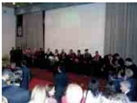
Aspecto geral da mesa