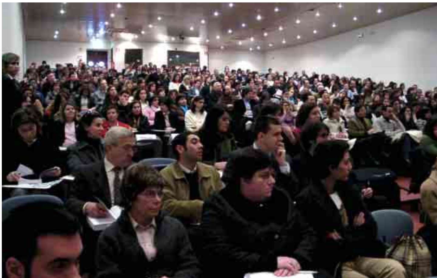
Aspecto geral da assistência (Auditório 1)

Nos dias 3 e 4 de Março decorreu, no Auditório 1 da Universidade Lusíada do Porto, um encontro nacional de Direito do Trabalho promovido pelo Centro de Estudos Judiciários e pela Inspeção Geral do Trabalho com o patrocínio do Instituto Lusíada de Direito do Trabalho.