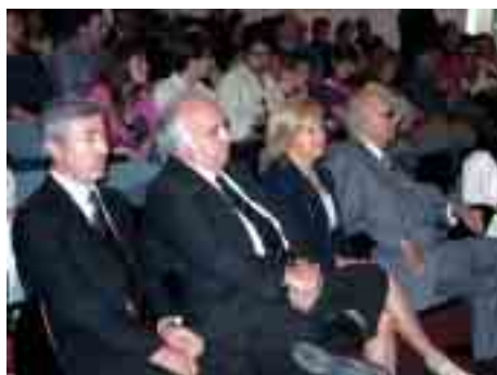
Aspecto geral da assistência