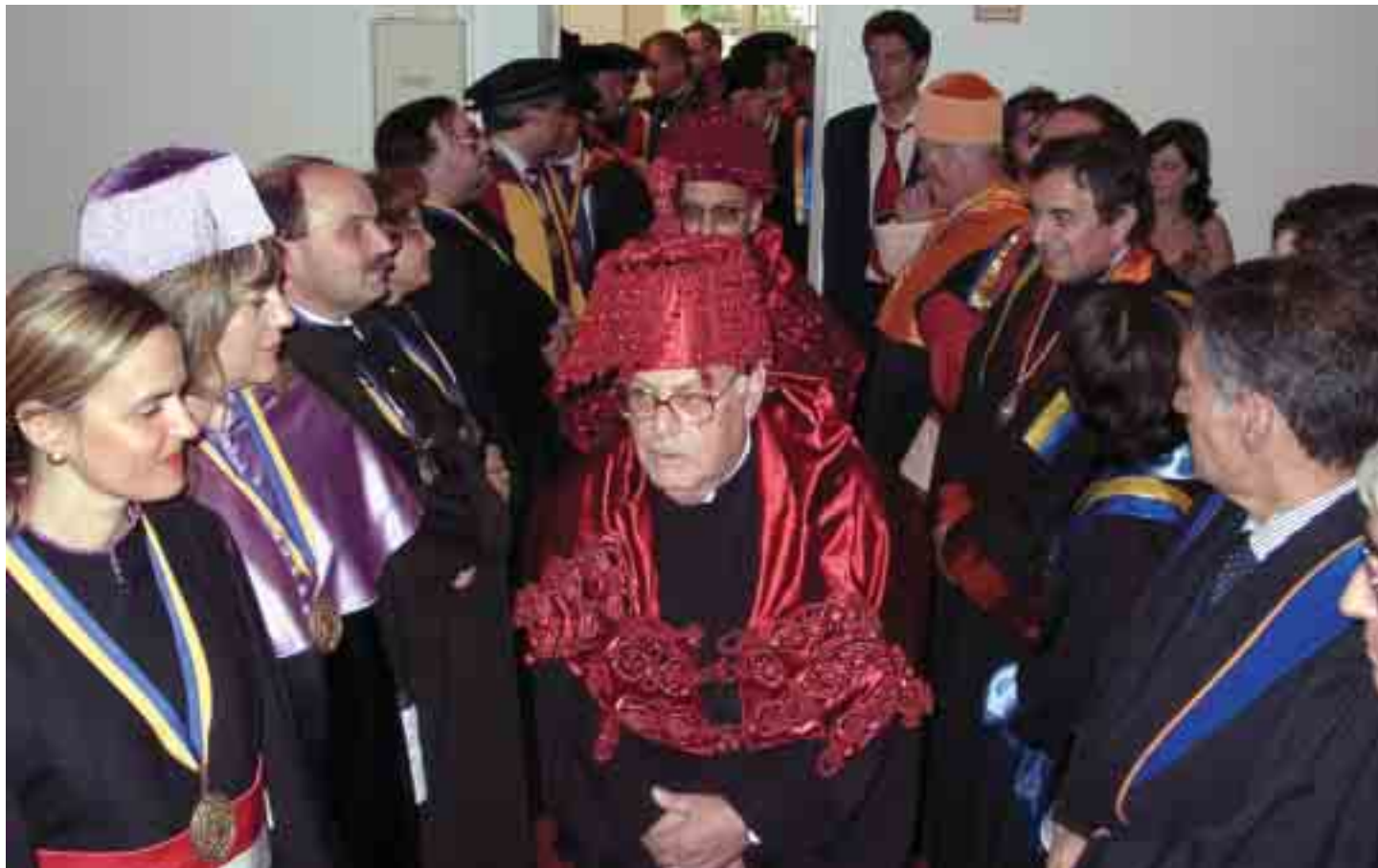
Aspecto geral do Cortejo Académico na entrada para o Auditório 1

Realizou-se, no passado dia 28 de Maio, no campus da Universidade Lusíada do Porto (ULP), a Sessão Solene de Encerramento do Ano Lectivo . As festividades tiveram início pelas 12:00 horas, com uma Missa de Acção de Graças nos jardins da Universidade, junto à Capela, e foram poucos os lugares sentados