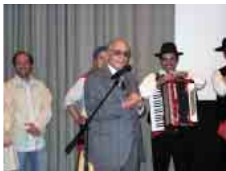
Presidente do Conselho de Administração e Chanceler das Universidades Lusíada, Prof. Dr. António Martins da Cruz, na actuação do Grupo de Danças e Cantares