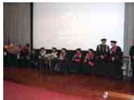
Aspecto geral da mesa