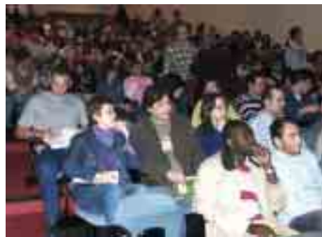
Aspecto geral da assistência (Auditório 1)

De entre os prémios obtidos destacamos: 1998, Sede do Governo da província do Brabante-Flamengo, Louvaina, Bélgica; 1999, Sede da Orquestra Metropolitana de Lisboa;