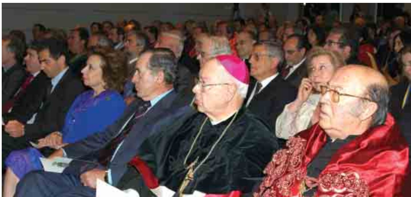
Aspecto geral da assistência

também não quis deixar de testemunhar a importância do evento. RTP, SIC, TVI, Jornal Público, Rádio Renascença, Agência Eclésia, Jornal Família Cristã foram alguns dos órgãos portugueses que fizeram a cobertura da cerimónia, entrevistando o Cardeal sobre assuntos da actualidade ●