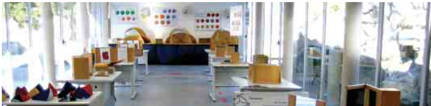
Aspecto geral da Exposição

com a participação de Professores, tanto do ensino Secundário como Universitário, bem como alunos do Curso de Matemáticas Aplicadas. Nos sete dias em que a exposição esteve patente ao público, foram disponibilizados 35 blocos para visitas em grupo, de 90 minutos cada, que rapidamente foram preenchidos por alunos de diversas escolas. Para além das marcações, recebemos inúmeras visitas de professores, assim como turmas de cursos profissionais, os quais