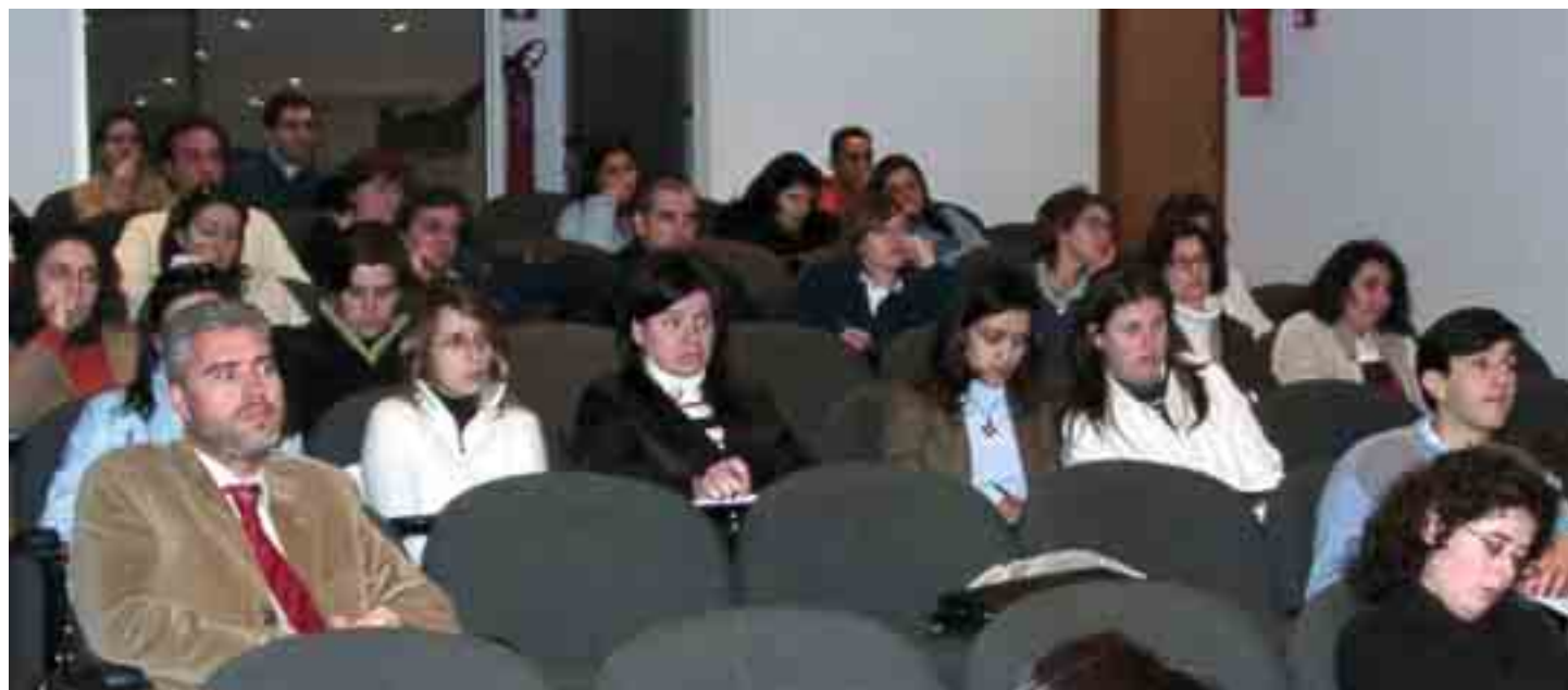
Aspecto geral da assistência (Auditório 2)

entre outros, levar os visitantes a reconhecer o contributo da Matemática para a compreensão e resolução de alguns dos problemas do Homem através dos tempos ●