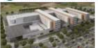
HOSPITAL BEATRIZ ÂNGELO