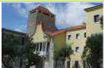
HOSPITAL DO MAR

Internamento, Consulta Externa e Bloco Operatório