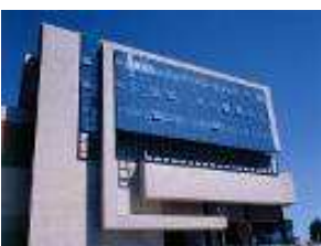
Hospital da Arrábida

Cada estágio decorre numa área – e.g. Internamento Médico Cirúrgico, Internamento da Mulher e Criança, Internamento Cuidados Continuados e Paliativos, Hospital de Dia Cirúrgico ou Consulta Externa