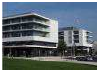
HOSPITAL DA LUZ